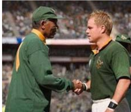
Morgan Freeman als Mandela feliciteert Matt Damon als Pienaar in de film Invictus